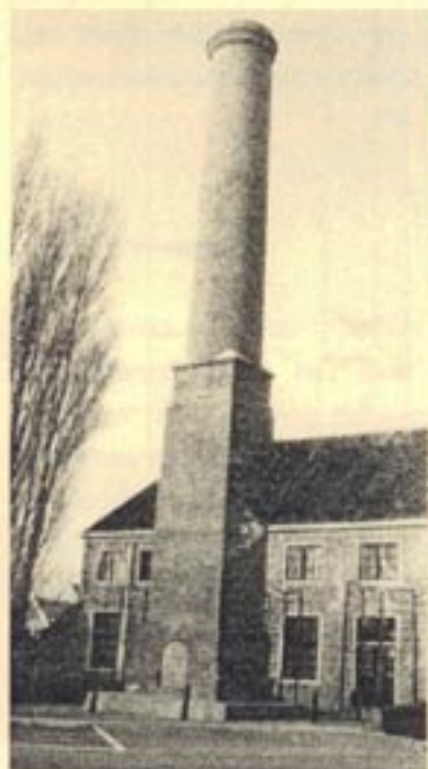
Zeepezierij Alkmaar, ca. 1820

Verder is een begin gemaakt met het opzetten van een documentatiesysteem over schoorstenen in Nederland. STIF wil proberen het landelijk documentatiepunt voor