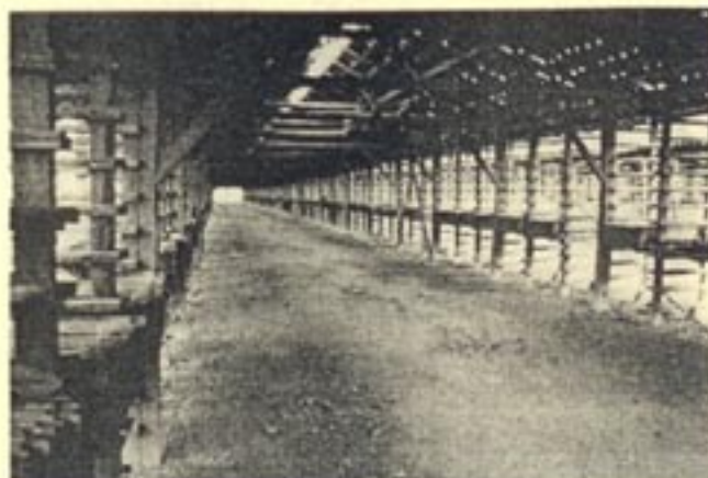
Eén van de droogloodsen

het bedrijf tot het einde leidde. Bijzonder van het fabriekscomplex is de compleetheid; in alle details is