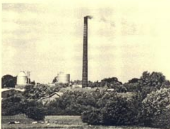
Heteren, steenfabriek Randwijk

Onder het motto 'Ruimte voor Cultuur' wordt in het rapport gepleit voor selectief behoud van historisch waardevolle steenfabrieken in de Gelderse uiterwaar-