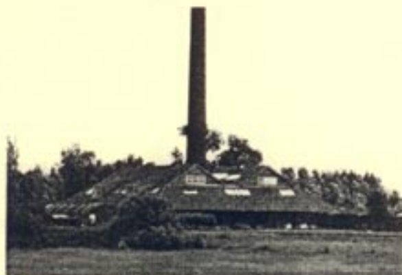
Wageningen, steenfabriek de Bovenste Polder

Voor het samenstellen van het rapport zijn in de