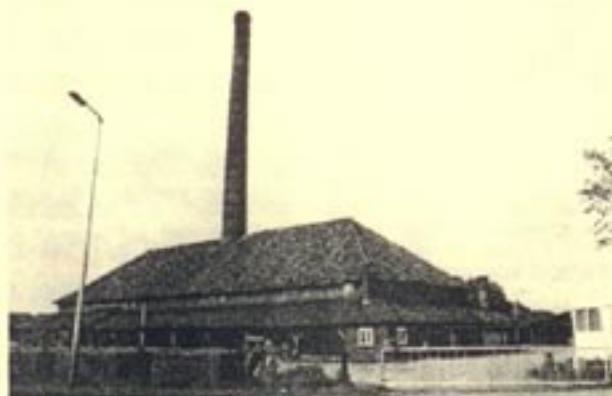
Werklust vóór de restauratie

In februari bracht het STIF-bestuur een bezoek aan de in restauratie verkerende steenfabriek te Losser. De fabriek ligt in het lichtgloeiende Twentse landschap in